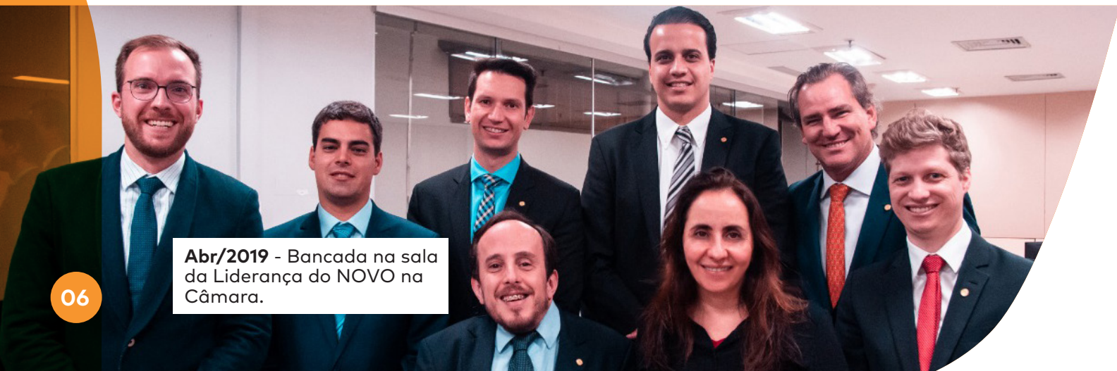
Abr/2019 - Bancada na sala da Liderança do NOVO na Câmara.