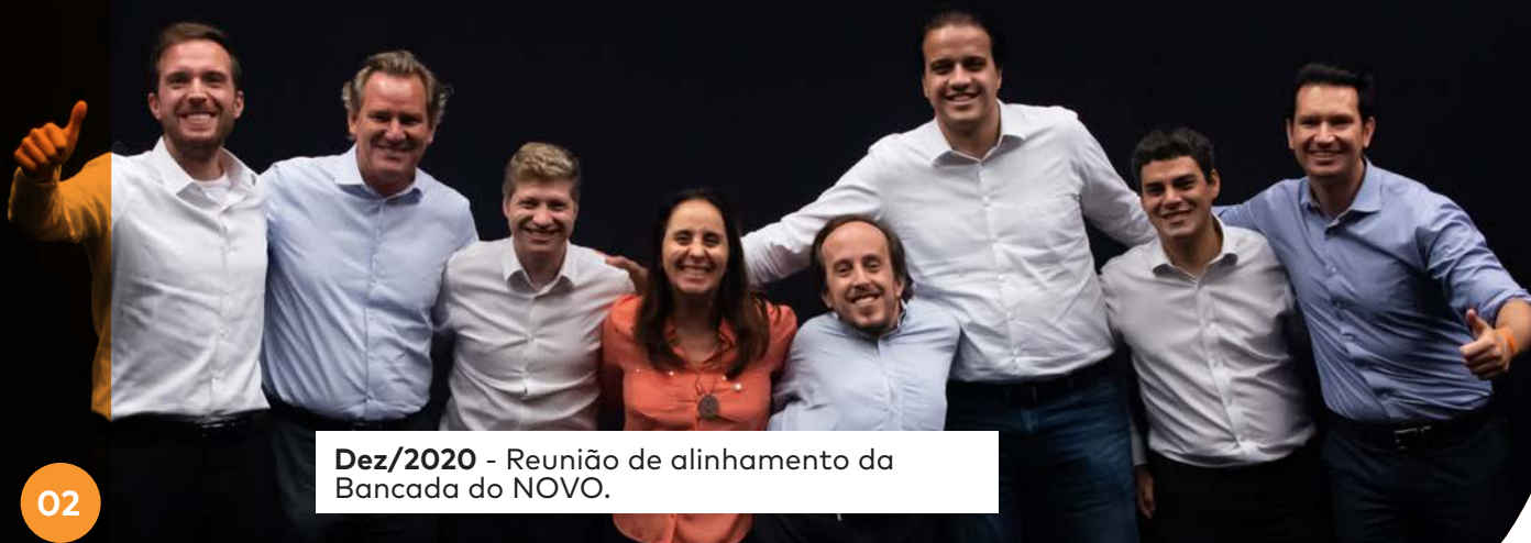
Dez/2020 - Reunião de alinhamento da Bancada do NOVO.

Conseguimos retirar da PEC 23/2021 uma tentativa de acabar com a Regra de Ouro, regra essa que é essencial para garantir a responsabilidade fiscal do governo federal ao impedir a contração de dívida para pagamento de despesas correntes. Contrários à PEC dos Precatórios, que estabelece um limite para o pagamento dos precatórios a partir de 2022, tivemos nosso destaque pelo fim da Regra de Ouro aprovado em Plenário por 5 votos.