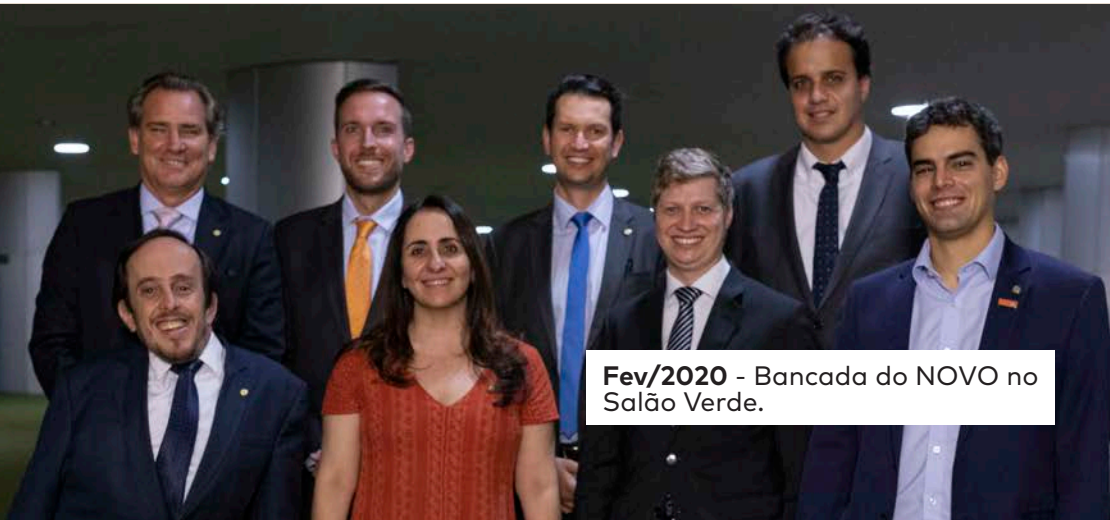
Fev/2020 - Bancada do NOVO no Salão Verde.

Aprovamos emenda de nossa autoria que otimizou a distribuição de recursos aos Estados para enfrentamento à Covid-19, além de termos contribuído para o congelamento salarial do funcionalismo público durante a pandemia ( Lei Complementar 173/2020 ).