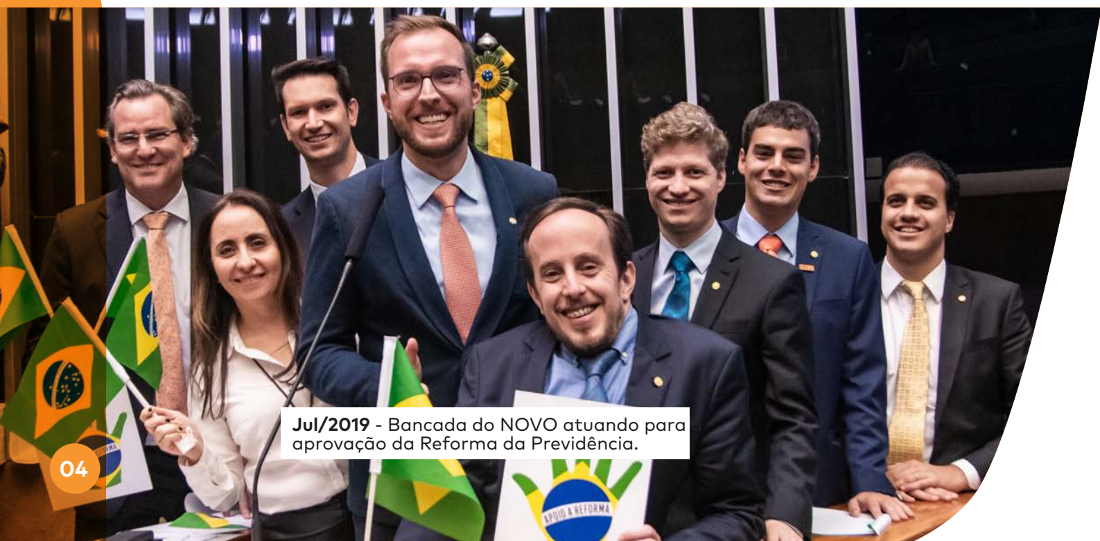
Jul/2019 - Bancada do NOVO atuando para aprovação da Reforma da Previdência.

Um estudo feito pelo Observatório Legislativo Brasileiro comprovou que o NOVO foi o partido que mais entregou apoio à reforma ( Emenda Constitucional 103/2019 ).