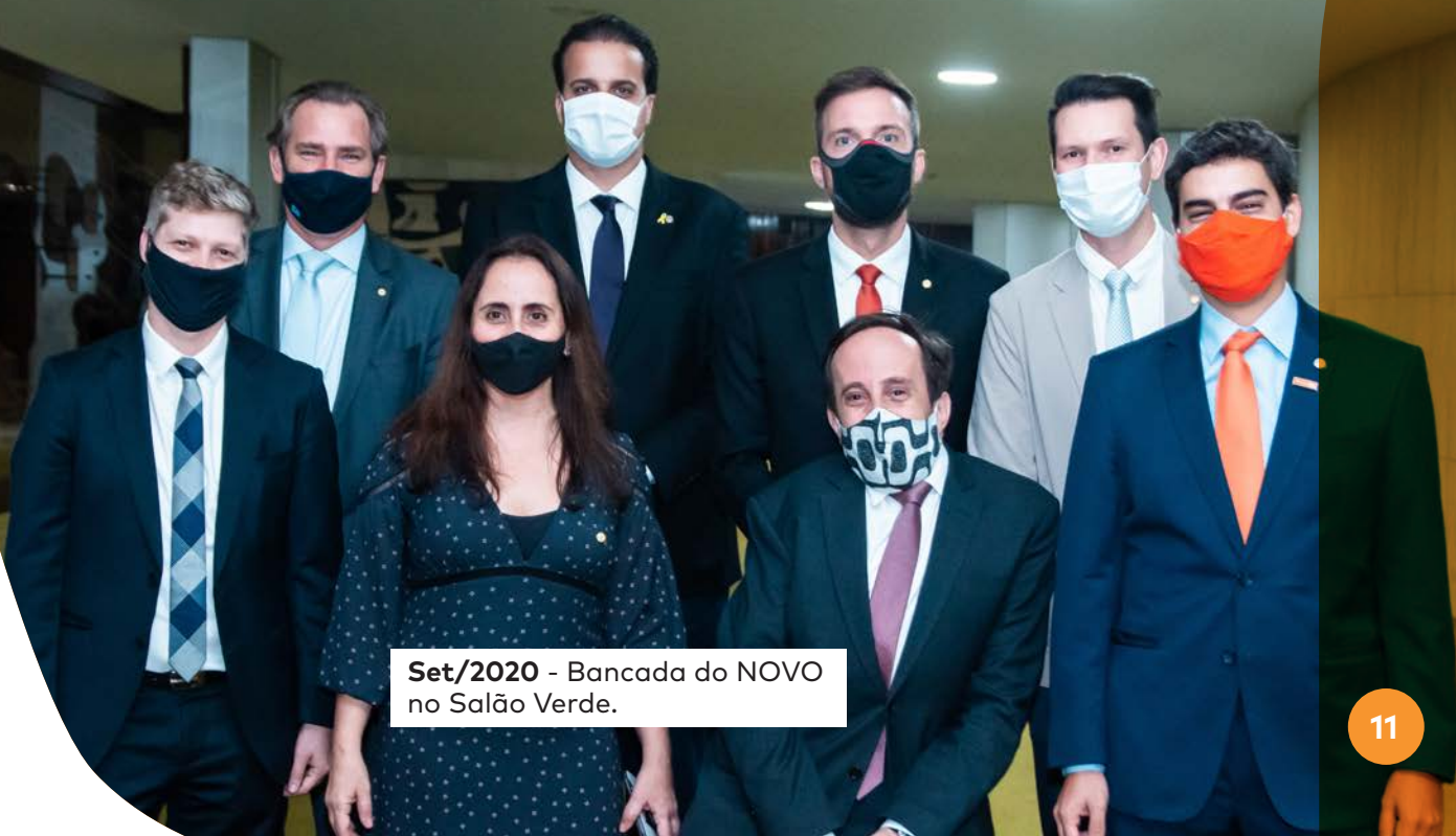
Set/2020 - Bancada do NOVO no Salão Verde.

Permitimos parcerias entre o setor público e a iniciativa privada no processo de Regularização Fundiária Urbana a partir de emenda do deputado Vinicius Poit à MP da Casa Verde Amarela. Trata-se da Emenda 56, que replicava o texto do PL 413/2020, de autoria da bancada. Com essa nova possibilidade, ficou menos burocrático e mais fácil regularizar um imóvel, ter CEP e, com isso, ter acesso a serviços básicos como água, luz e saneamento (MP 996/2020).